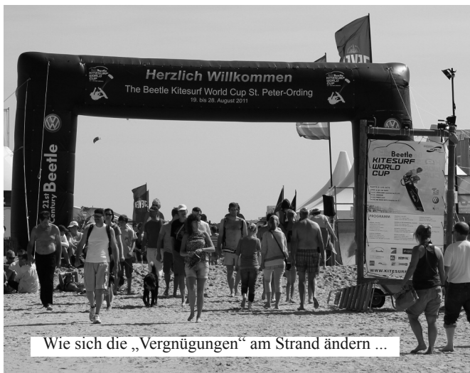
Wie sich die „Vergnügungen“ am Strand ändern ...