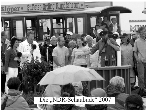
Die „NDR-Schaubude“ 2007