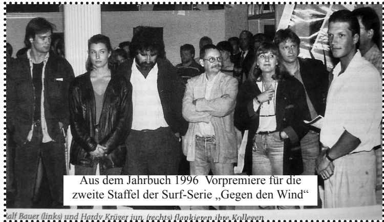
Aus dem Jahrbuch 1996 Vorpremiere für die zweite Staffel der Surf-Serie „Gegen den Wind“